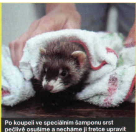
Po koupeli ve speciálním šamponu srst pečlivě osušíme a necháme ji fretce upravit