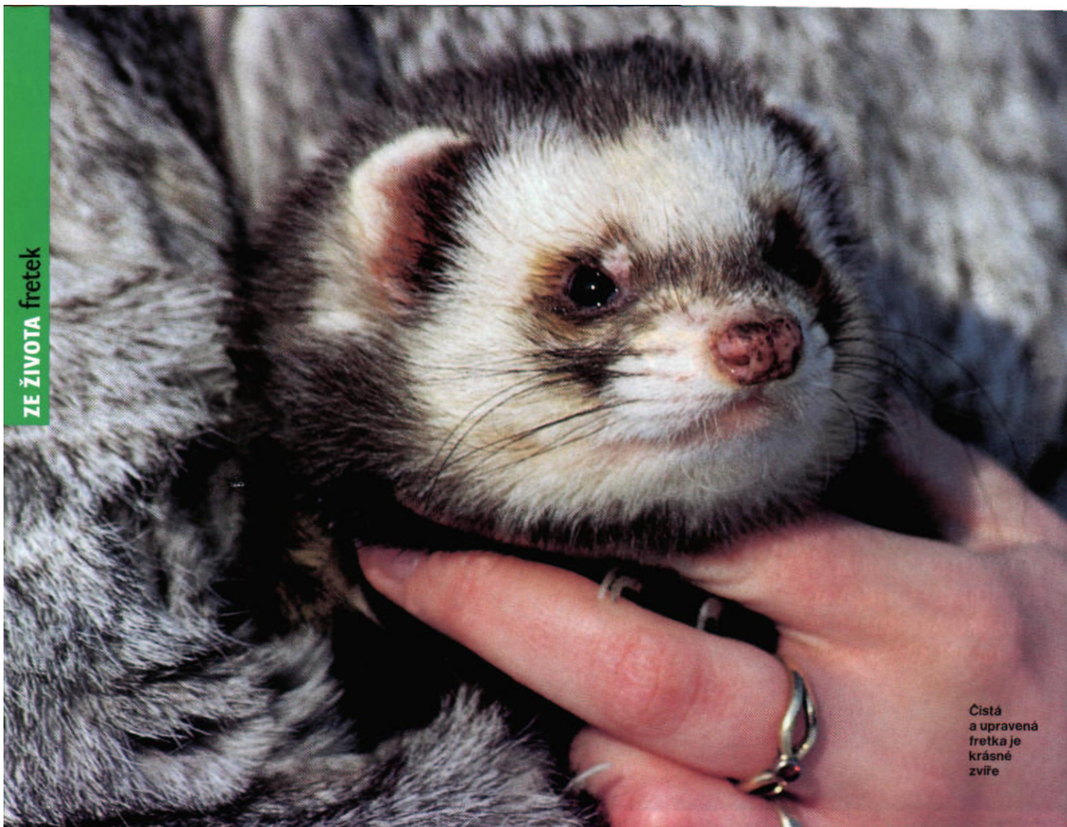
Cistá a upravená fretka je krásné zvíře