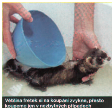
Většina fretek si na koupání zvykne, přesto koupeme jen v nezbytných případech