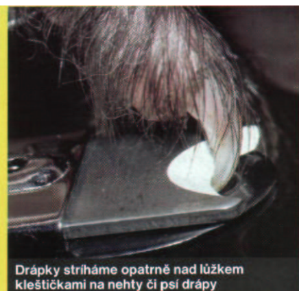
Dráčky stříháme opatrně nad lůžkem kleštičkami na nehty či psí drápy